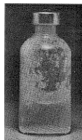
Fig. 3 - Não use este medicamento se partículas no fundo ou na parede derem ao frasco um aspecto fosco (embaçado).

Uso de seringa adequada: as doses de insulina são medidas em unidades . O número de unidades em cada mililitro (mL) está claramente impresso na embalagem. Cada tipo de insulina está disponível na concentração de 100 unidades/mL. É importante entender as graduações na seringa porque o volume a ser injetado depende da concentração, que é o número de unidades por ml. Por esta razão, deve-se utilizar sempre uma seringa graduada para a concentração de insulina. Erro no uso da seringa pode levar a um erro na dose, causando sérios problemas, como variação na glicemia (taxa de glicose no sangue) que pode ser muito baixa ou muito alta.