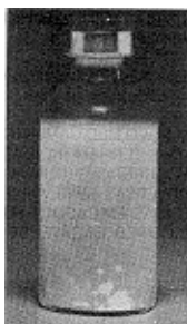
Fig. 2 - Não use este medicamento se houver grumos em suspensão (soltos) no líquido após a agitação.