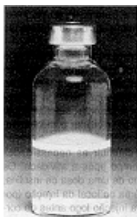
Fig. 1 - Não use este medicamento se o material permanecer no fundo do frasco após a agitação.

Verificar sempre o frasco de insulina antes de usar. Se você notar qualquer diferença na aparência ou alterações marcantes nas características da insulina, consulte o médico.